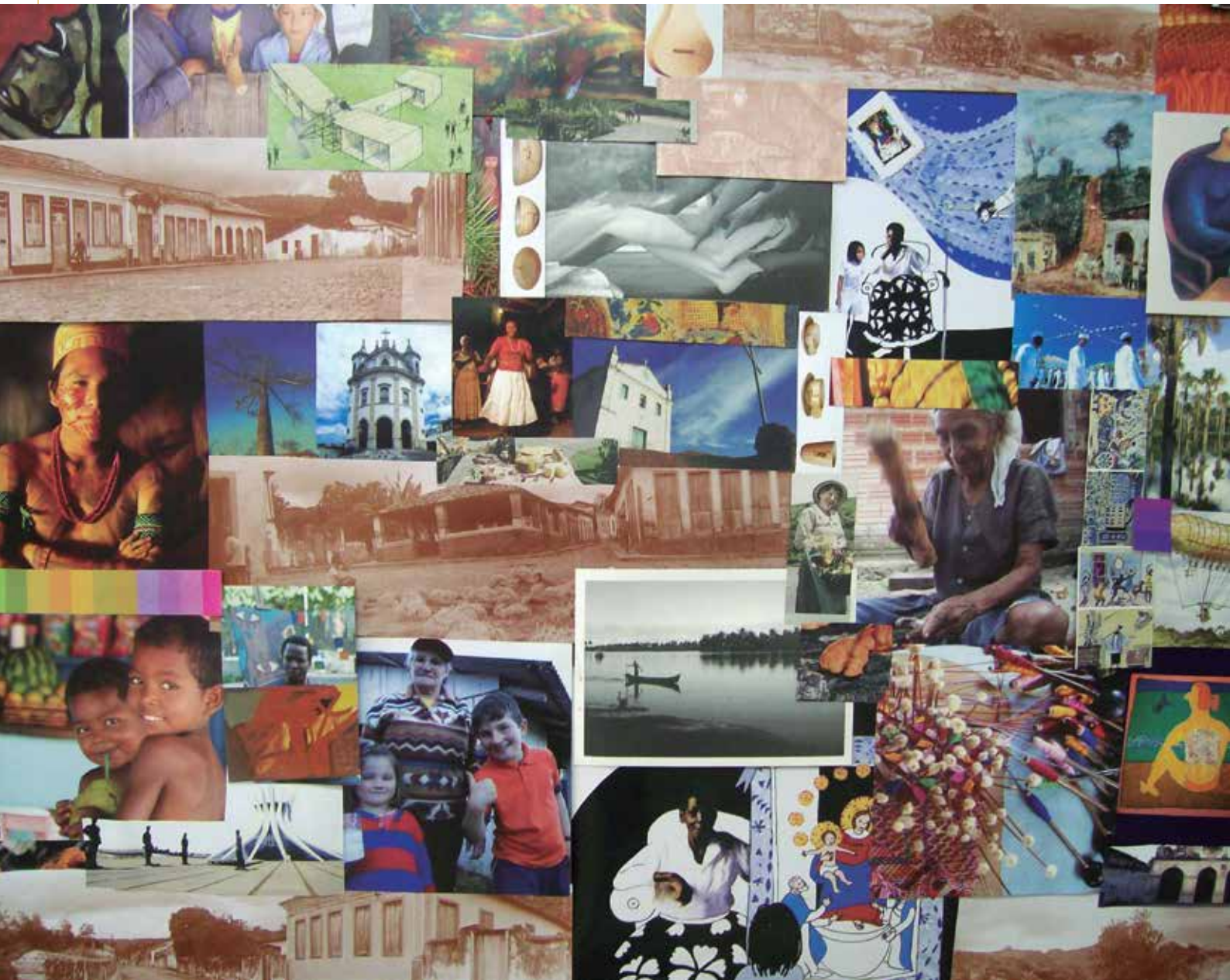
Mosaico CEDUC.