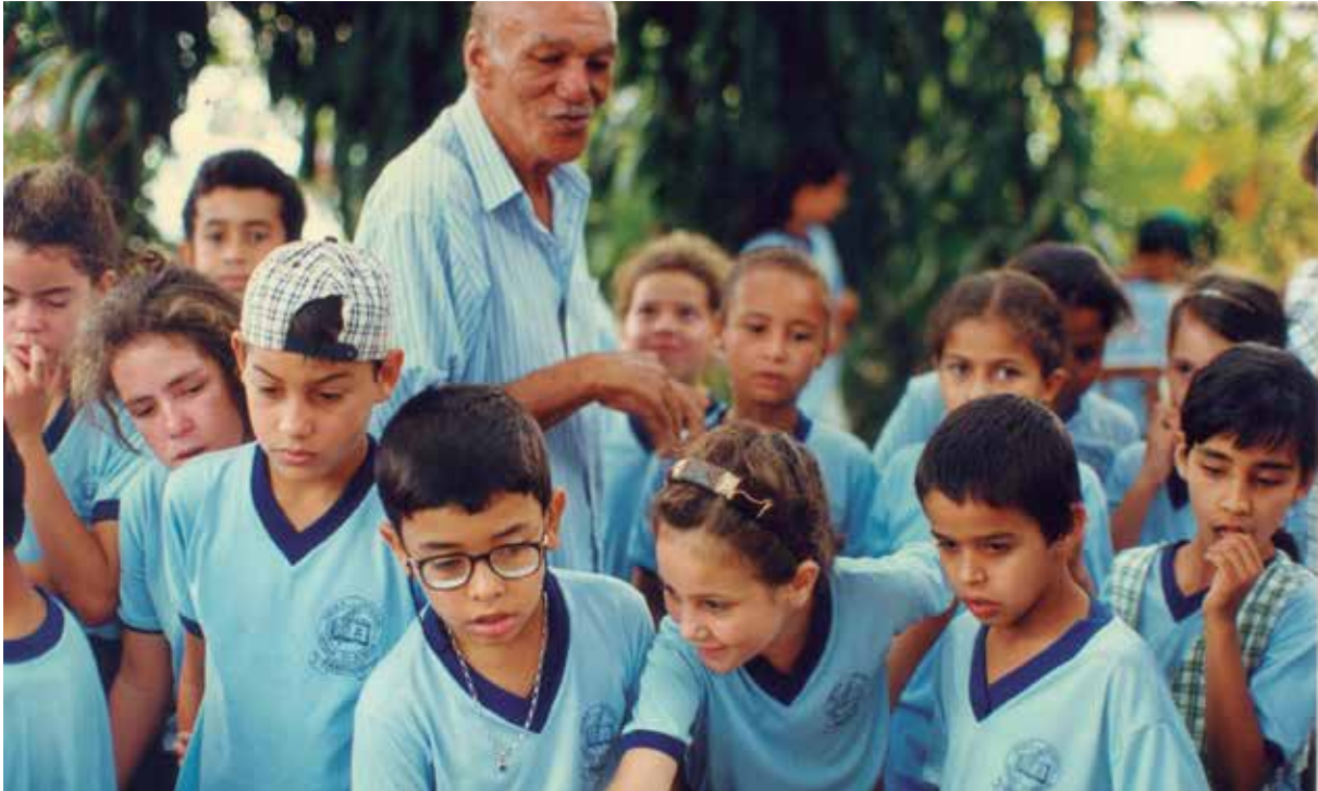
Projeto “Conhecer para Preservar”, em Pirenópolis, GO.

Paralelamente, no 1º Seminário sobre o Uso Educacional de Museus e Monumentos, realizado no Museu Imperial de Petrópolis-RJ, ocorre, em 1983, a introdução no Brasil da expressão Educação Patrimonial como uma metodologia inspirada no modelo da heritage education , desenvolvido na Inglaterra. Em 1996, Maria de Lourdes Parreiras Horta, Evelina Grunberg e Adriana Queiroz Monteiro lançaram o Guia Básico de Educação Patrimonial , que se tornou o principal material de apoio para ações educativas realizadas pelo IPHAN durante a década passada.