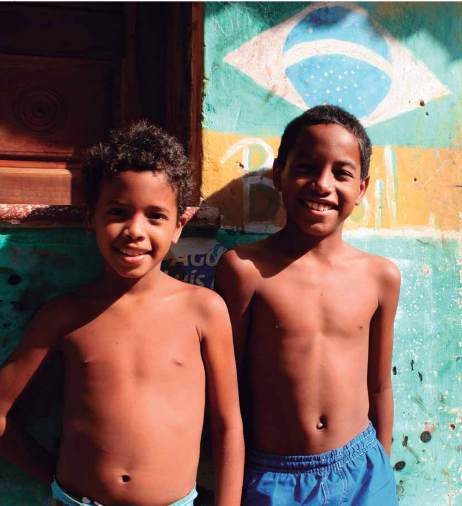
Crianças em Alcântara, MA.