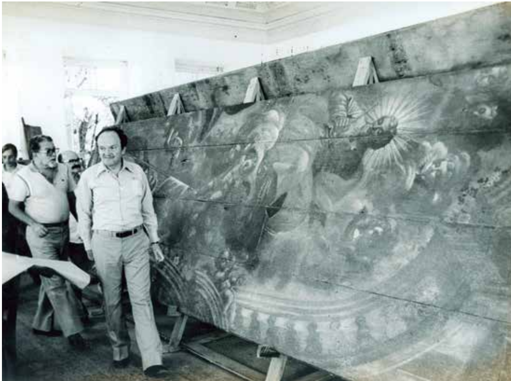
Aloísio Magalhães.

Entretanto, somente a partir de meados da década de 1970 é que a questão foi abordada de modo mais insistente, com a criação do Centro Nacional de Referência Cultural – CNRC, sob a iniciativa de Aloísio Magalhães 3 . Surgido de discussões semanais promovidas por um pequeno grupo envolvendo funcionários do alto escalão do governo federal e do Distrito Federal, aos quais se uniram alguns professores da UnB, o CNRC iniciou suas atividades em junho de 1975, mediante convênio firmado entre a Secretaria da Educação e Cultura do Distrito Federal e a Secretaria de Tecnologia Industrial do Ministério da Indústria e Comércio.