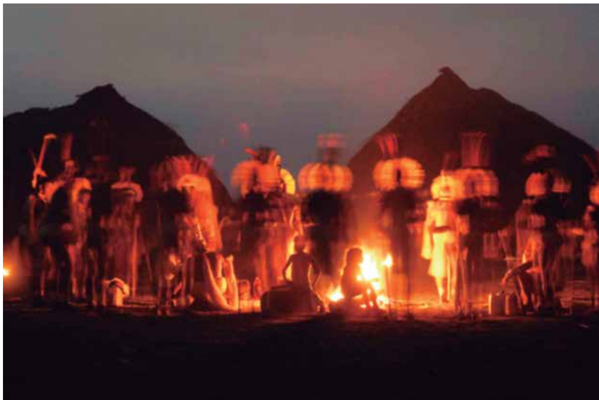
Aldeia Enawênê Nawê, MT.