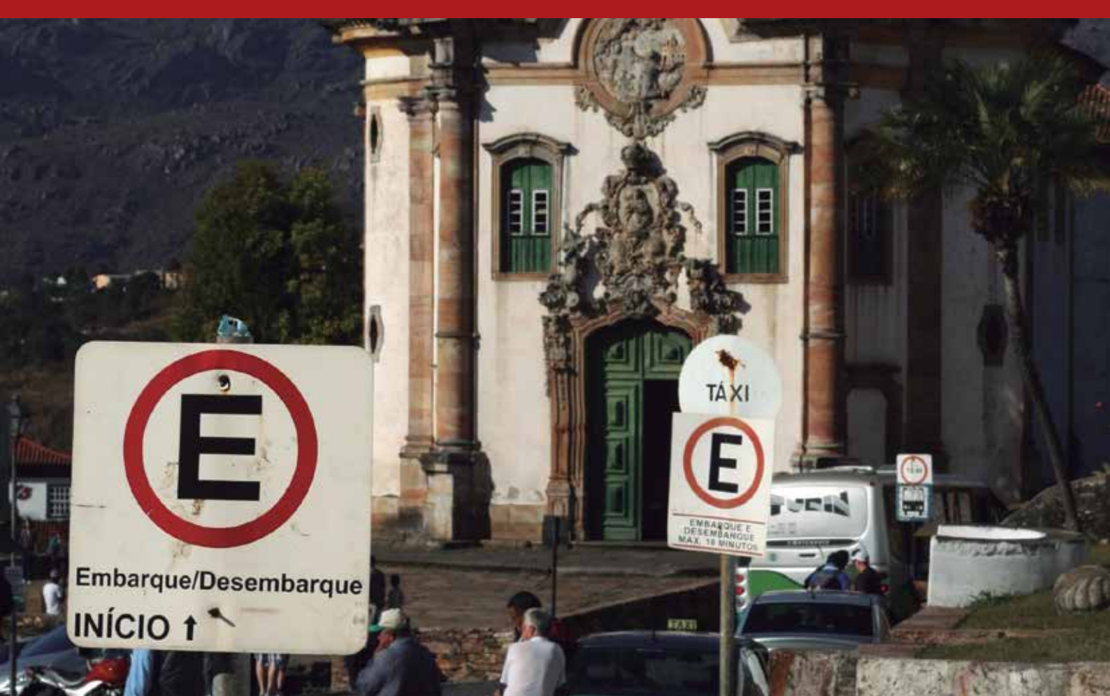
Ouro Preto, MG.