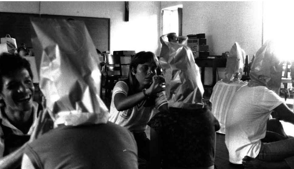
Dinâmica de grupo em Recife, PE - Projeto Interação. Foto: Tadeu Gonçalves.

A proposta defendida pelo Projeto Interação consistia, de acordo com documentos disponíveis, no apoio à criação e ao fortalecimento das condições necessárias para que o trabalho educacional se produzisse referenciado na dinâmica cultural, reafirmando a pluralidade e a diversidade cultural brasileira. Partia da constatação da ineficácia de propostas pedagógicas que deixavam de levar em conta as especificidades da dinâmica cultural local e não correspondiam às necessidades de seu público-alvo. Em contraposição, procurava relacionar a Educação Básica com os diferentes contextos culturais existentes no país e diminuir a distância entre a educação escolar e o cotidiano dos alunos, considerando a ideia de que o binômio cultura-educação é indissociável. Cultura aqui era entendida como: