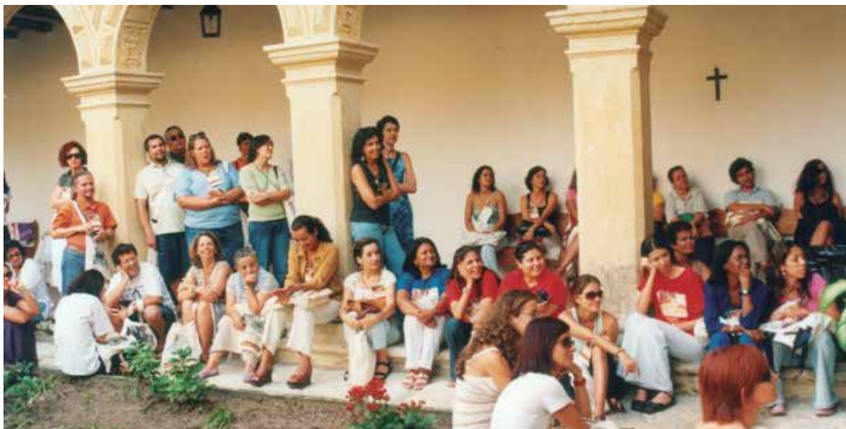
I ENEP, São Cristóvão, SE - Foto: Nalva Santos.