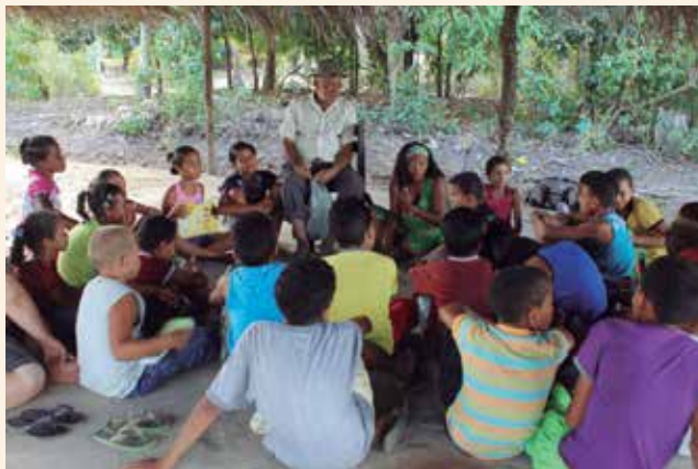
Vale do Gramame, João Pessoa, PB

Todas as unidades do IPHAN vêm trabalhando para se tornar Casas do Patrimônio. O objetivo do projeto é fomentar um desenho organizacional baseado em princípios de gestão em rede das ações educativas de valorização do Patrimônio Cultural. Nessa direção, os componentes da rede estão conectados de maneira auto-organizada, destituída de hierarquia, em constante expansão, não-linear e horizontal.