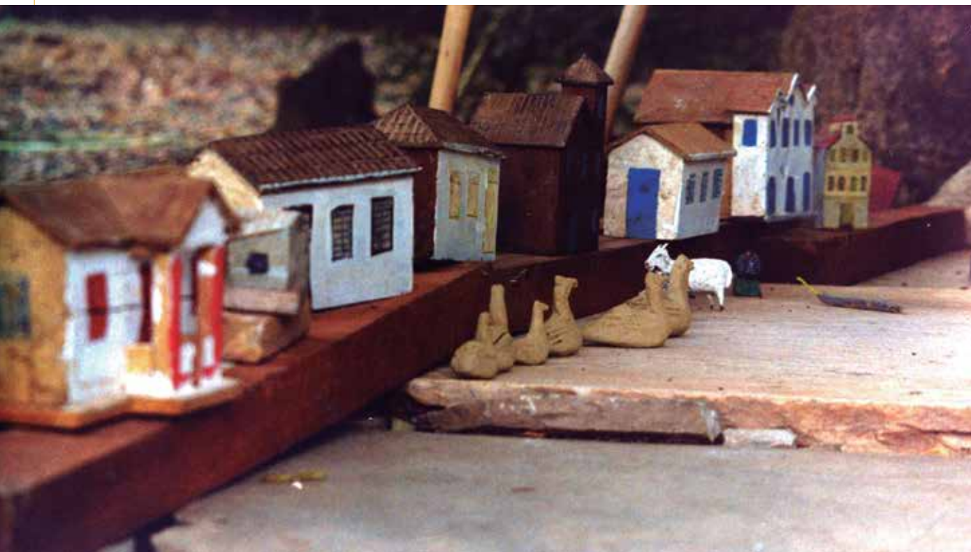
Projeto “Conhecer para Preservar”, em Pirenópolis, GO.

Em decorrência da necessidade de uma maior sistematização das ações educativas no âmbito das políticas de preservação, o IPHAN, por meio de seu setor de promoção, passou a estruturar e consolidar uma área específica voltada para as ações educativas ligadas à preservação do Patrimônio Cultural brasileiro. Em 2004, o Decreto nº 5.040/04 cria uma unidade administrativa responsável por promover uma série de iniciativas e eventos com os objetivos de discutir diretrizes teóricas e conceituais e eixos temáticos norteadores, consolidar coletivamente documentos e propostas de encaminhamentos e estimular o fomento à criação e reprodução de redes de intercâmbio de experiências e parcerias com diversos segmentos da sociedade civil.