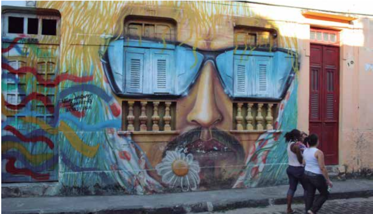
Grafite em Olinda, PE.

A política de Educação Patrimonial do IPHAN está estruturada em três eixos de atuação: