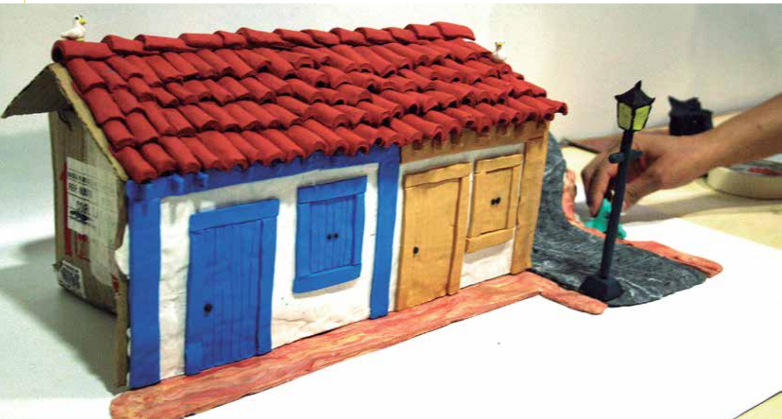
Oficina em Pirenópolis, GO.