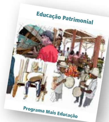
Capa do Inventário Pedagógico Mais Educação .

O IPHAN está disponível para contribuir com as escolas que escolherem a atividade de Educação Patrimonial, tanto nas fases de planejamento e execução dos inventários quanto na promoção de seus resultados.