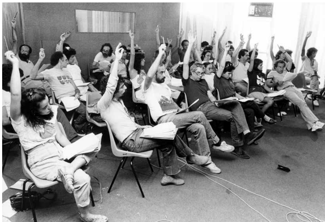
Projeto Interação.

Ações destinadas a proporcionar à comunidade os meios para participar, em todos os níveis, do processo educacional, de modo a garantir que a apreensão de outros conteúdos culturais se faça a partir dos valores próprios da comunidade. A participação referida se efetivará através da interação do processo educacional às demais dimensões da vida comunitária e da geração e operacionalização de situações de aprendizagem com base no repertório regional e local (BRANDÃO, 1996, p. 293).