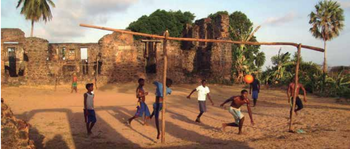
Jogo de futebol nas Ruínas de Alcântara, MA.

A experiência acumulada de iniciativas bem-sucedidas bem como o alinhamento com preceitos extraídos das reflexões de educadores e profissionais das ciências humanas permitem identificar certos princípios norteadores que amplificam a eficácia do reconhecimento e da apropriação dos bens culturais e, por conseguinte, a relevância da implementação dos vários instrumentos legais de proteção do Patrimônio Cultural.