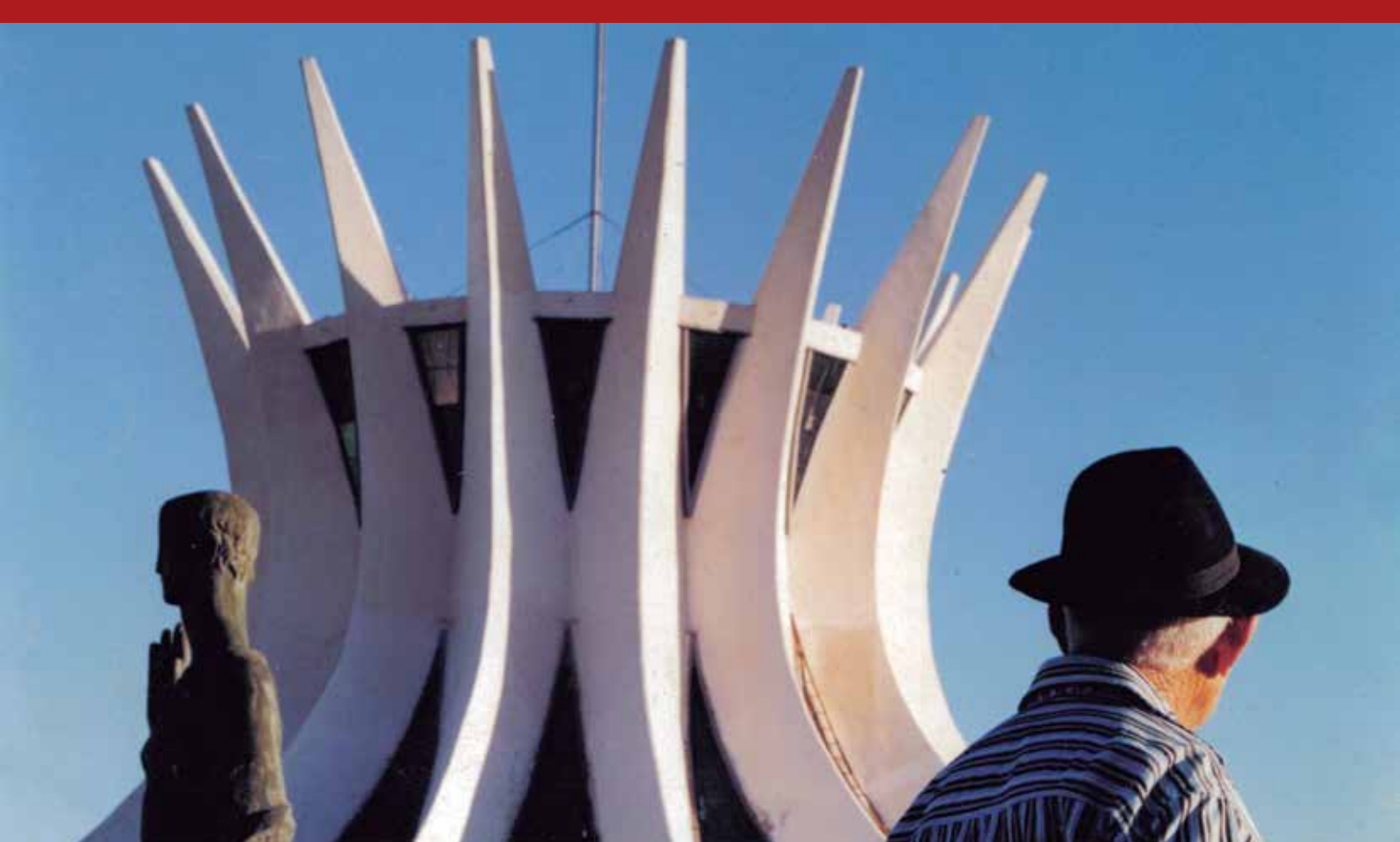
Catedral de Brasília, DF.