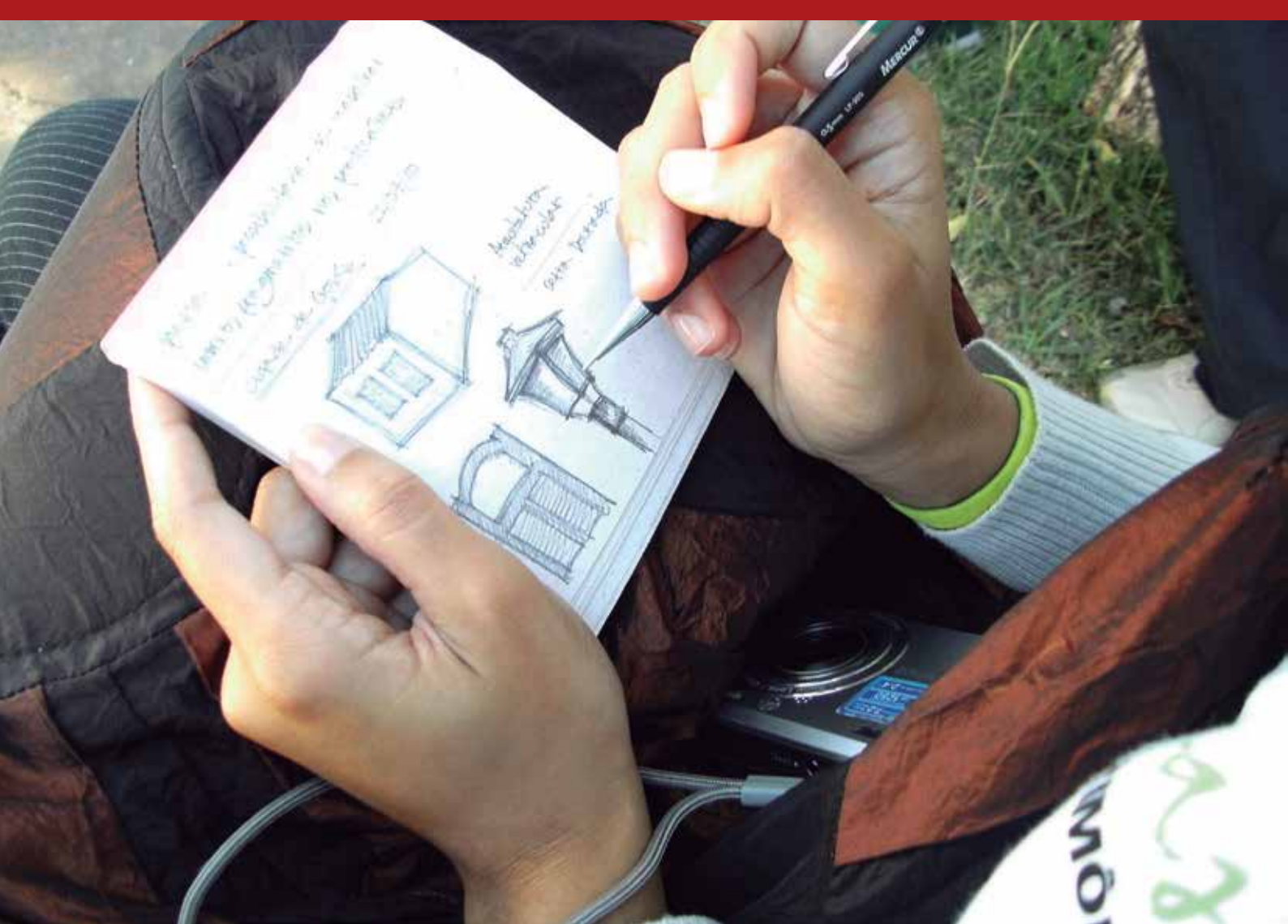
Fórum Juvenil do Patrimônio Mundial, Brasília, Brasil, 2010.