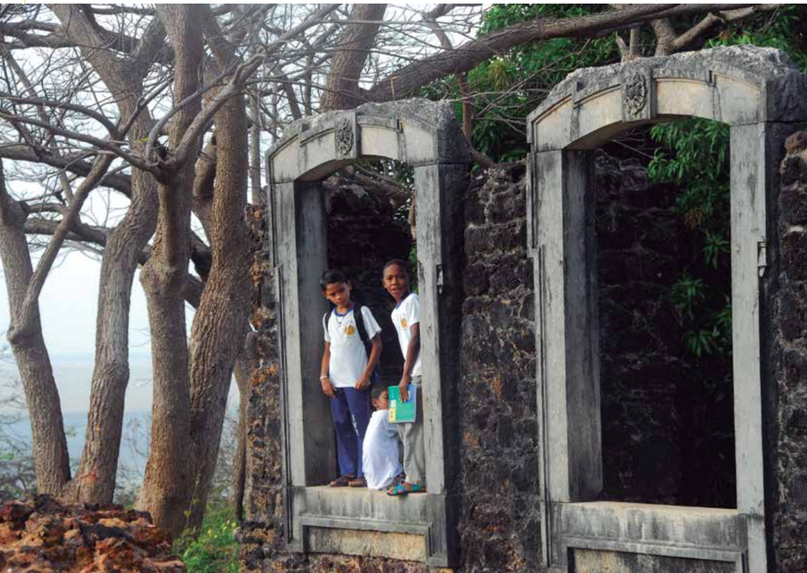
Ruínas de Alcântara, MA.

O inventário traz um conjunto de fichas para organizar e reunir informações sobre o Patrimônio Cultural local, partindo do olhar dos estudantes. As categorias utilizadas para classificar os diversos bens culturais – Lugares, Objetos, Celebrações, Formas de Expressão e Saberes – se baseiam nas categorias que o próprio IPHAN/MinC adota em seus trabalhos de identificação e reconhecimento do Patrimônio Cultural do Brasil.