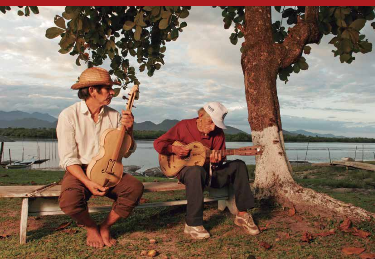
Fandango caiçara, em Guaraqueçaraba, PR.