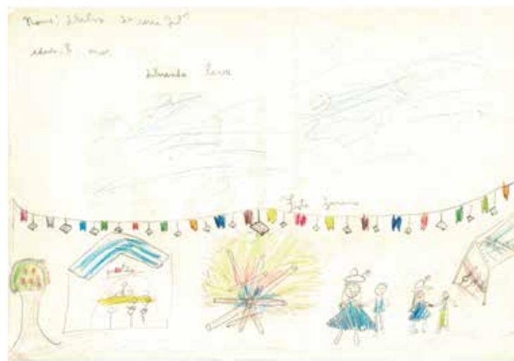
Ilustrações de alunos em atividades promovidas pelo Projeto Interação.