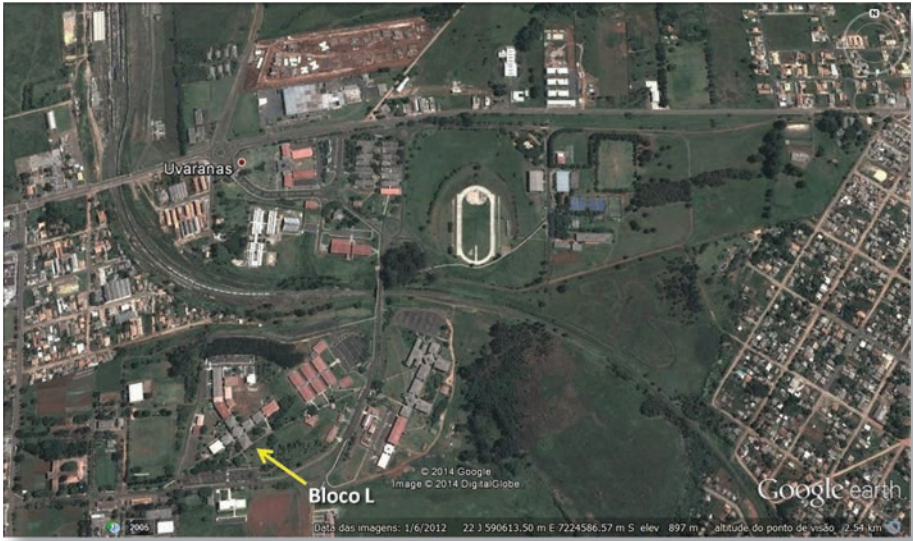
Figura 1 – Vista geral da área do Campus Uvaranas. Ao centro pista de atletismo. No rumo sudoeste da pista observa-se o conjunto de blocos didáticos em que se localiza também o Bloco L e a Exposição Geodiversidade na Educação.

Para facilitar os cálculos iniciais dessa analogia propõe-se desconsiderar o Éon Hadeano, uma vez que quase nada desse intervalo cronológico foi preservado da intensa dinâmica de processos modeladores do planeta. Assim, os 4 bilhões dos demais éons (Arqueano, Proterozoico e Fanerozoico) corresponderiam aos 400 metros da pista (poderia se utilizar 56 m externos como área de aquecimento e deste modo incluir o Hadeano). Isto significa que cada metro cobriria 10 milhões de anos.