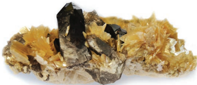
Zinwaldita, conhecida popularmente como "Mica Estrela", em associação com quartzo fumê. Procedência: Araçuaí, MG.

Coleção Laboratório de Geologia.