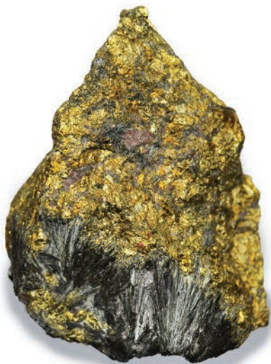
Calcopirita (amarela) com anfibólio da Mina do Sossego (onde se obtém principalmente cobre e ouro), em Carajás, Pará.

como material de estudo. Em vários casos são apresentados, também, alguns exemplos de aplicação dos minerais na vida moderna, como materiais de apoio para a engenharia de materiais.