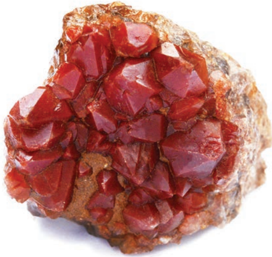
Cristais de quartzo demantoide ou jacinto são a variedade laranja-avermelhada do quartzo, que apresenta esta cor em virtude da presença de ferro. Procedência: Jacobina, Bahia. Coleção: Laboratório de Geologia.

Na classificação e valoração das gemas são utilizados critérios muitas vezes subjetivos como raridade, procedência, tradição, moda e até confiança, e os fatores que definem o seu preço final são principalmente cor, limpidez, lapidação e peso. A cor equivale a 50% do valor da gema e subentende matiz, tom e saturação; a limpidez corresponde a 30% do valor e refere-se à presença ou não de inclusões; na lapidação são analisadas as proporções, simetria e acabamento final do talhe influenciando em até 20% do valor. Estes dados compõem o preço da gema por quilate, que é proporcional ao seu tamanho e o valor final é obtido de tabelas específicas.