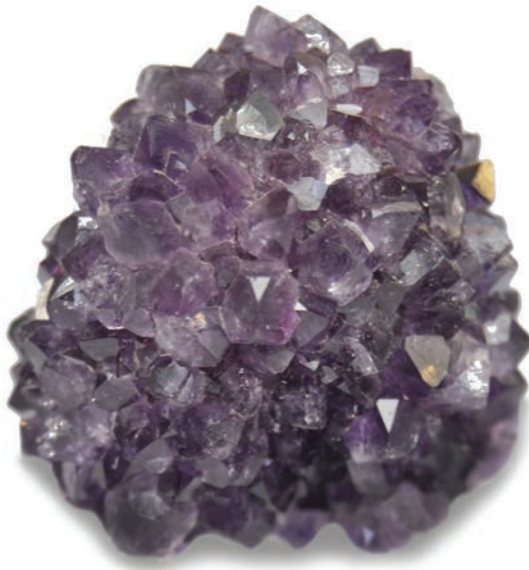
A variedade violeta do quartzo é conhecida como ametista e o Brasil produz amostras fantásticas deste material. Esta formação com aspecto de estalactite é típica da jazida de Entre Rios, SC. Coleção: Liccardo.

As gemas são, por definição, materiais extremamente raros na crosta terrestre o que as tornam, na maior parte das vezes, preciosas e caras. São anomalias, exceções da natureza, mas que refletem com clareza a enorme complexidade do Sistema Terra. As gemas estão ligadas à história do Brasil e ao contexto de evolução socioeconômica de maneira muito estreita, sendo este fato desconhecido pela maioria das pessoas. A presença das gemas inorgânicas no território brasileiro são um dos parâmetros – talvez o mais fascinante – para se tentar dimensionar a geodiversidade brasileira e sua importância na participação dos rumos da sociedade.