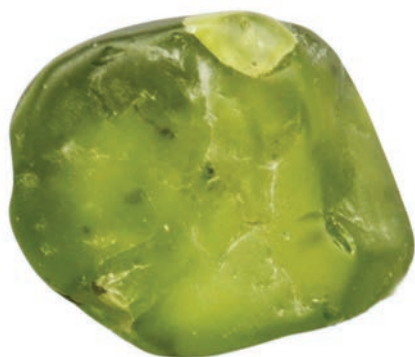
O peridoto é uma olivina de qualidade gemológica. Este é um dos principais minerais que compõem o manto terrestre. Cristal proveniente de San Carlos, Arizona – EUA. Coleção: D. Svizzero.