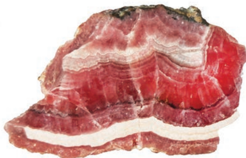
A rodrosita é um carbonato de manganês que apresenta, frequentemente, padrões de crescimento e feições típicas de ambiente de cavernas, como estalactites ou estalagmites. Amostra cortada e polida proveniente da mina La Capillita, na Argentina. Coleção: Liccardo. Imagem: Raony.