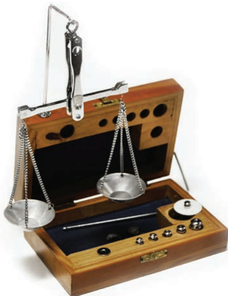
Balança de madeira utilizada na pesagem de gemas, produzida na década de 1970. Atualmente são utilizadas balanças eletrônicas que se tornaram mais baratas e precisas.

Na identificação de gemas lapidadas são utilizadas somente técnicas específicas que não danifiquem a pedra, chamadas de testes não destrutivos , principalmente densidade e propriedades ligadas à luz como cor, caráter óptico e índices de refração. Para exames rotineiros são utilizados instrumentos como lupa, pinça, balança, paquímetro, dicróscópio, polariscópio, refratômetro e o microscópio gemológico.