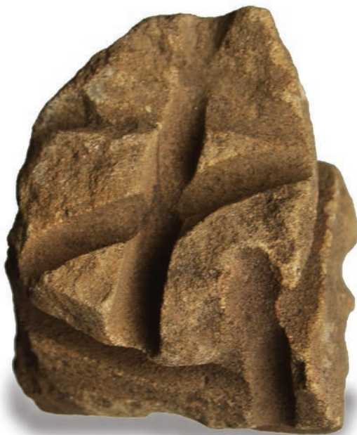
Afiador lítico em arenito (tradição Itararé – Taquara) datado de cerca de 4.000 anos, proveniente de Ivaí – PR.