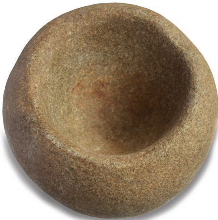
Artefato lítico utilizado para moagem entalhado

chegada dos europeus, ilustram o entendimento que temos de um passado remoto (em termos humanos; ver capítulo 3) e de nossos antepassados.