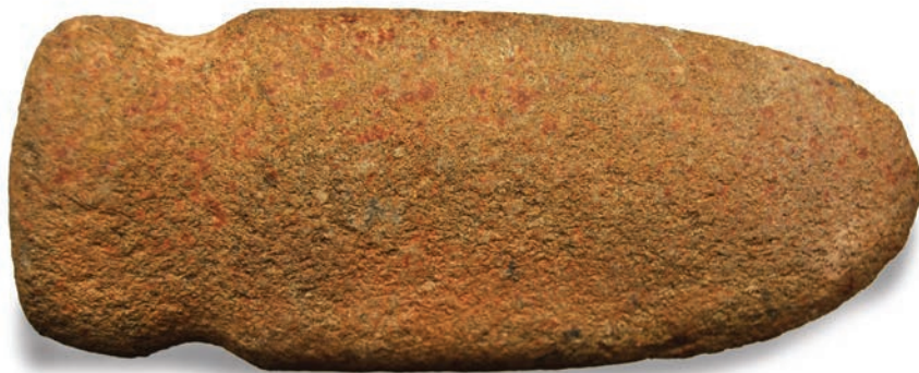
Machado lítico em diabásio (Tradição Itararé – Taquara)

Os primeiros sinais de povoamento no território paranaense remontam a aproximadamente 10 mil anos. Povos nômades nesta época viviam da caça de animais e coletas de frutos e mel. Desde então houve mudanças climáticas e alterações radicais na fauna e na flora, o que teria determinado maior ou menor concentração de sítios arqueológicos na região. Os vestígios atualmente conhecidos apontam algumas fases de ocupação nos Campos Gerais, que são descritas em tradições Paleoíndios, Umbu, Humaitá, Planalto, Geométrica, Itararé-Taquara, Tupiguarani e Neobrasileira (conforme PARELLADA 2007).