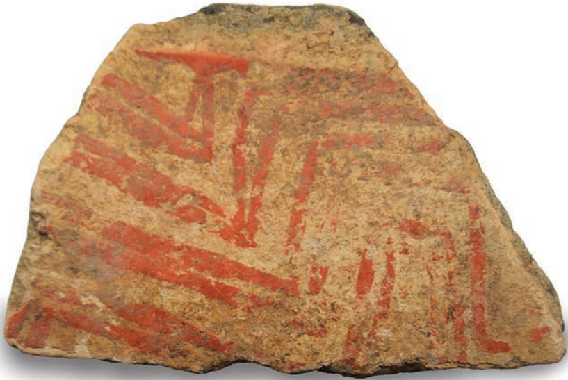
Fragmento cerâmico com pinturas geométricas (cultura Tupi-Guarani), com cerca de 1.000 anos, proveniente de Ivaí – PR.

No Brasil existem ainda áreas não exploradas e com muitas possibilidades para pesquisas, o que seria de uma riqueza muito grande na valorização da cultura nacional, na compreensão de nosso passado, no reconhecimento das sociedades que já viveram e ainda vivem. A arqueologia se propõe a tentar montar as peças deste quebra-cabeça e possivelmente revelar uma parte de nossa identidade ou registros formadores de uma herança. A exposição de algumas peças no projeto “Geodiversidade na Educação” decorre da enorme curiosidade por este tema e pela riqueza de artefatos líticos e cerâmicos que constituem o acervo. O melhor entendimento deste material pode contribuir para um novo olhar sobre a diversidade cultural e geográfica do passado no Paraná.