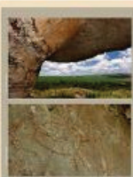
Uma pintura de um ser humano em uma caverna, Parque Estadual de Itaipu.