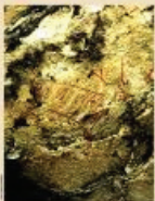
Uma pintura de um animal em uma caverna, Parque Estadual de Itaipu.

No Brasil as pinturas rupestres são representações pictóricas de povos que viveram entre 10 mil e 50 mil anos atrás. As pinturas têm um modo único de se apresentar por que os povos que as fizeram não tinham a escrita e não tinham a imprensa. Assim, a única maneira de se comunicar era através das pinturas, que serviam para registrar os acontecimentos da vida cotidiana, as atividades religiosas, as festas, as guerras, as celebrações, as atividades de caça, etc.