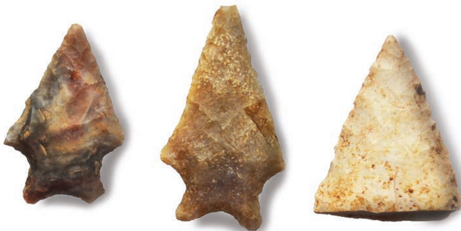
Pontas de projéteis em sílex (tradição Umbu) com idade de até 10.000 anos procedentes de Ivaí, PR. Coleção: Laboratório de Geologia.

sítios arqueológicos representando a fonte destes artefatos. Posteriormente, por volta de 4.000 anos atrás, encontram-se registros de culturas que construíam estruturas subterrâneas e elaboravam peças em cerâmica.