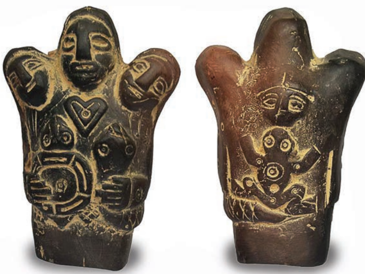
Réplica de cerâmica da cultura Santarém, datada de 1000 a 1500 anos - Amazônia Brasileira.