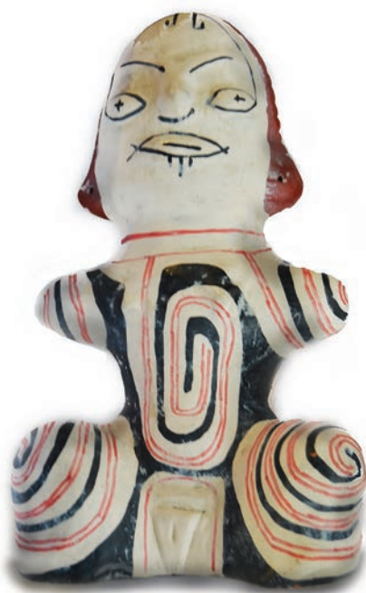
Estatueta feminina faliforme (réplica), cerâmica marajoara entre 400 e 1.300 anos, Belém – PA. Coleção: Liccardo.