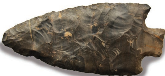
Ponta de projétil em sílex proveniente de Ivaí, PR.