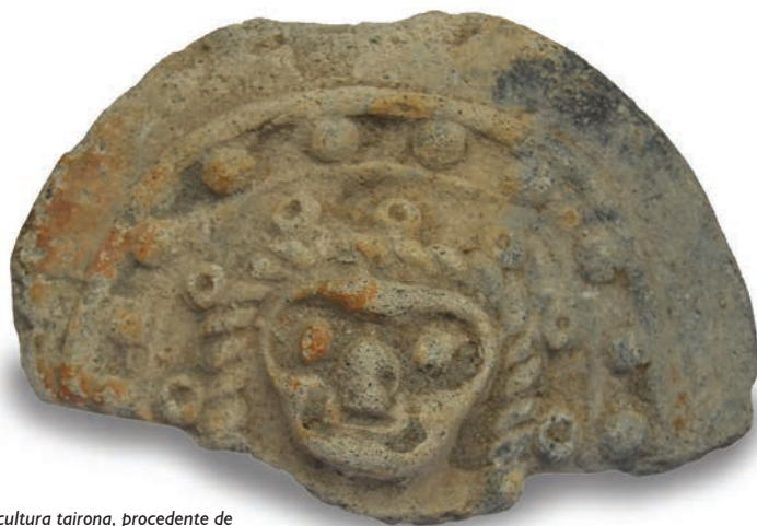
Cerâmica globular da cultura tairona, procedente de Sierra Nevada de Santa Marta – Colômbia. Coleção: Liccardo.