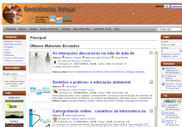
Figura 2. Tela de abertura do Geociências Virtual, obtida em 06/09/2011.

Além da disponibilização dos materiais, o ambiente possui o objetivo de propiciar espaços de diálogo para construção online de conhecimentos, como o espaço para avaliar os materiais, os fóruns